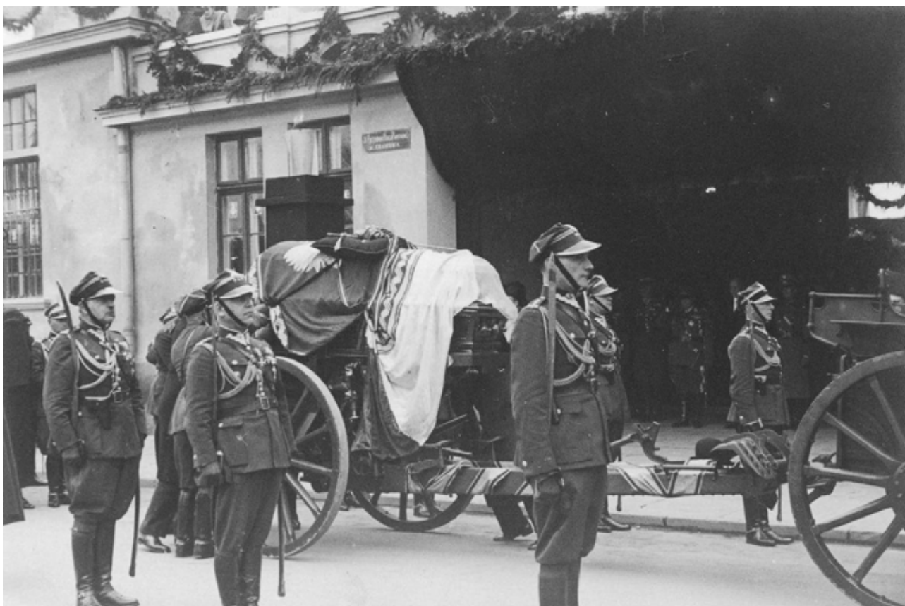
Foto: wikimedia commons / domena publiczna, laweta z trumną w otoczeniu wojska przed budynkiem dworca zachodniego.

Marszałek Józef Piłsudski, zasłużony Ojciec Niepodległości, zmarł 12 maja 1935 roku w Belwederze w Warszawie. Uroczystości pogrzebowe trwały od 13 do 18 maja. Współtwórca niepodległej Polski, został pochowany w krypcie św. Leonarda w katedrze wawelskiej. Pożegnano go z honorami, przy dźwiękach bicia dzwonu Zygmunta oraz 101 salwami armat ustawionych na wzgórzu wawelskim. W uroczystościach pogrzebowych wzięło udział około 250 tys. osób.