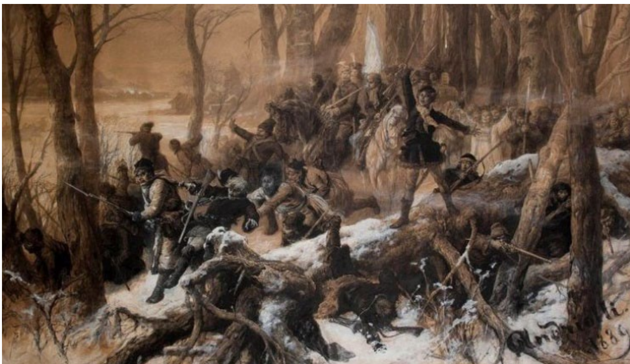
Walka powstańcza, mal. Michał Elwiro Andriolli

W dniu 22 stycznia br. minęła 157. rocznica wybuchu Powstania Styczniowego. Zryw narodowo - wyzwolńczy Polaków przeciwko rosyjskiemu zaborcy, był największym w XIX wieku. W ciągu trwających 20 miesięcy działań zbrojnych doszło do ponad tysiąca potyczek, a w walkach wzięło łącznie udział co najmniej 150 tys. powstańców. Około 20 tysięcy powstańców poległo, około tysiąca zostało straconych przez Rosjan, a 38 tysięcy zesłanych na Syberię. Mimo poniesionej klęski, powstanie w dłuższej perspektywie umocniło świadomość narodową i miało wpływ na dążenia niepodległościowe następnych pokoleń Polaków.